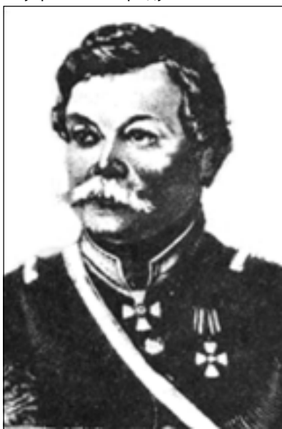
Ген. Н. Н. Муравьев-Карский

Так, например, ежегодный сбор хлебов (главная из «подотраслей» нашего тогдашнего Народного Хозяйства!) в империи увеличился со 155 млн. четвертей в 1806 г. до 216 млн. в 1861 г., однако в расчёте на душу населения за 60 лет он не возрос [Сахаров А. М. Экономическое развитие России в 1-й половине 19 в. // Большая Советская Энциклопедия. 2 изд. Т. 50. — М., 1957 г.]. Площадь же посевных площадей увеличилась (гл. о. за счёт степной полосы) примерно в это же время (1802 — 1861 гг.) с 38 млн. дес. и до 58 млн. Т. е., урожайность зерновых культур даже несколько снизилась. Среднегодовой же рост Валового Внутреннего Продукта России за