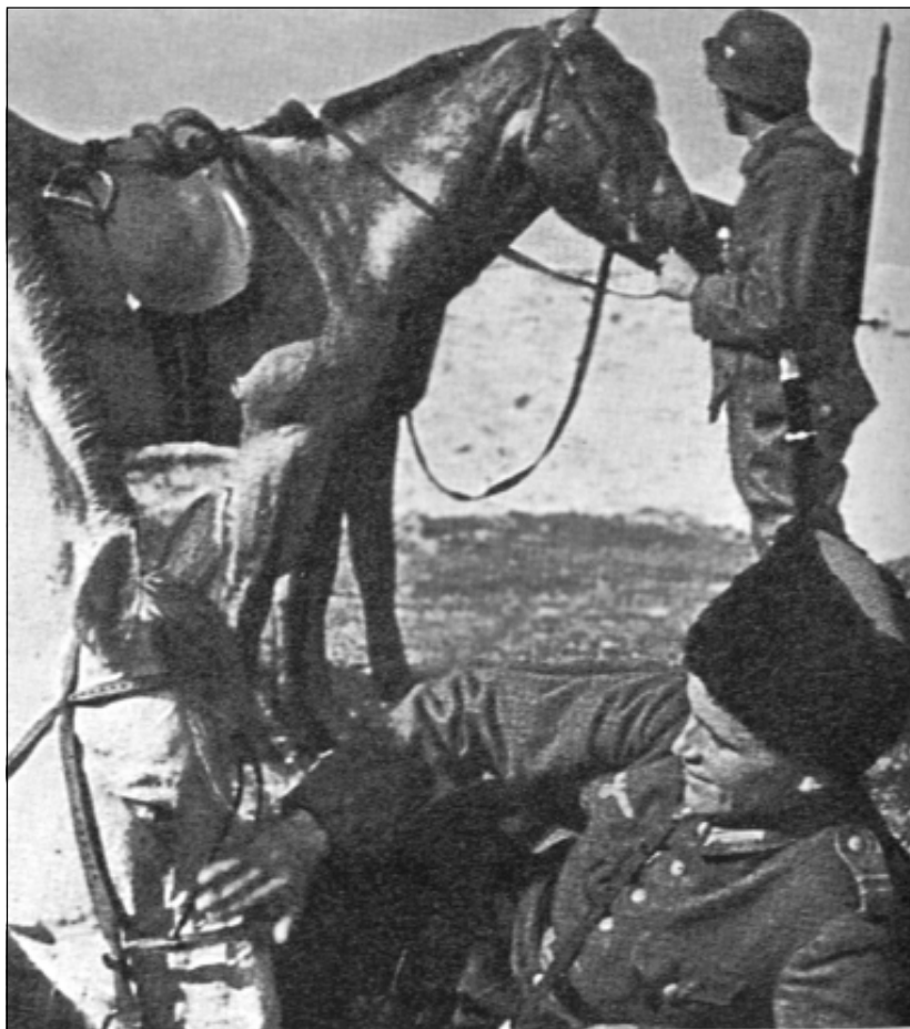
Русские казаки в составе Германского Вермахта

жища, не зная города, было бессмысленно, но сразу справа за мостом был небольшой скверик, а в нем щели, туда мы и бросились.