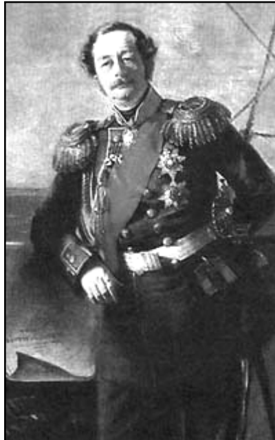
Иркутский ген.-губернатор Н. Н. Муравьев-Амурский

Переговоры переговорами, а военные действия шли своим чередом. В Евпатории сосредоточилось 35.000 аскеров Омер-паши. 5 (17) февраля 1855 г. 19-тысячный отряд ген. С. А. Хрулёва попытался овладеть этим оккупированным городом, но данный штурм был турками отбит. А. С. Меншиков был отставлен от должности и заменён ген. кн. М. Д. Горчаковым. 23 марта началась 2-я бомбардировка Севастополя союзниками, выявившая их подавляющее превосходство в количестве боеприпасов. Но героическое сопротивление гарнизона и жителей города (даже детей, собиравших