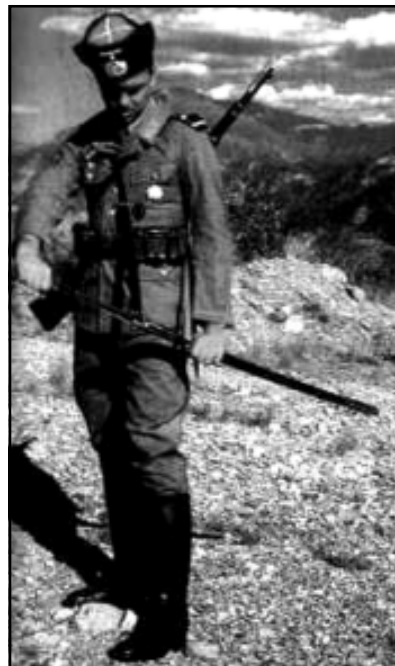
Казак из добровольческих частей вермахта

Никакой дискриминации по отношению к горцам и вот таким казакам-неказакам не было. Отношения были абсолютно боевые —