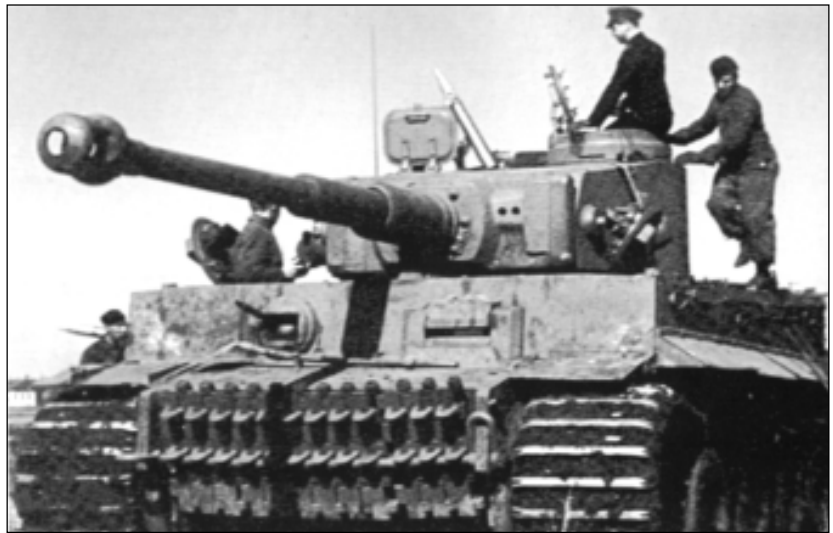
Немецкий танк Т-VI Тигр

По окончании войны в разделенной на оккупационные зоны Германии началась форменная охота за военными служащими танковой дивизии СС «Лейб-Штандарт Адольф Гитлера» (хотя в бою под Мальмеди участвовали лишь 5 танков «Пантера» из состава 1-го танкового полка, входившего в состав этой дивизии). В нарушение всех международных конвенций об отношении к бывшим военным служащим капитулировавших военных держав, солдат и офицеров 1-й танковой дивизии СС арестовывали и подвергали тюремному заключению уже после их фактического разоружения и, конечно, значительно позднее совершения самого юридического акта безоговорочной капитуляции Германии. Более 1100 младших офицеров и солдат танковой дивизии «Лейб-