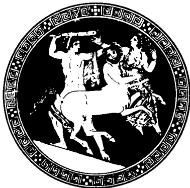
ГЕРАКЛ И КЕНТАВР НЕСС, ПОХИЩАЮЩИЙ ДЕЯНИРУ