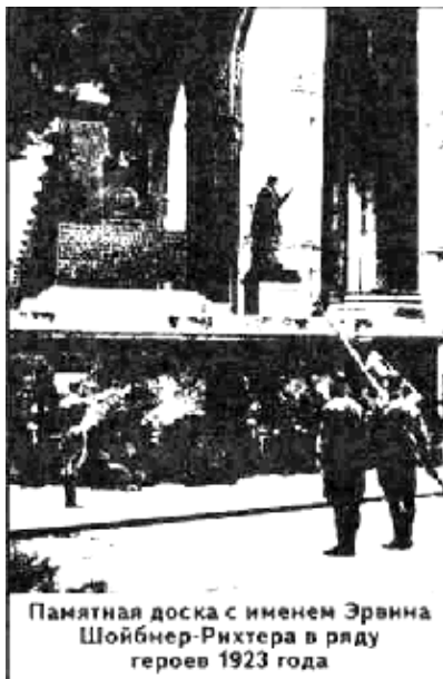
Памятная доска с именем Эрвина Шойбнер-Рихтера в ряду героев 1923 года

Все эти группы не теряли времени, стремясь продемонстрировать свое отношение к новой Германии и получить от этого выгоду. И Бискупский, и его друг Петр Шабельский уверяли Вильгельмштрассе в своих антибольшевистских настроениях и в преданности Германии. Сторонники правительства Директории Украины постоянно посылали в Министерство иностранных дел просьбы о деньгах и заявления, направленные как против сторонников Гетмана, так и против последователей Петлюры. Один из офицеров Авалова предложил Герингу и ведомством Вильгельмштрассе использовать эмигрантов при организации антисоветской террористической деятельности. Наконец, существовал меморандум некоего «Доктора Калигулы», от имени русского народа обращенный к самому Гитлеру, где заявлялось, что Красная армия готова к вос-