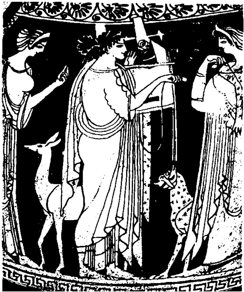
АПОЛЛОН, ЛЕТО И АРТЕМИДА

Решающим аргументом в пользу существования бессмертной души или «остаточного разумного биополя» является открытие врачом-реаниматором Р. Моуди реальности потустороннего мира, о котором рассказывают перенесшие клиническую смерть, большинство из воскресших повествуют о своем полете через темный туннель, в конце которого все ярче сияет некое воплощение наивысшего разума-света-любви. Модели такого туннеля встречаются уже в древнейших арийских курганах, а позднейшие (кануна ча-