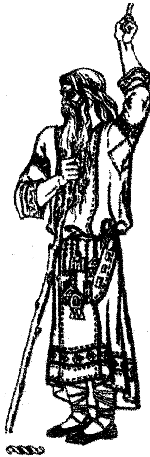
ВОЛХВ — БРАХМАН

магия, психология, астрология, география, этнопсихология, медицина и множество других наук, накопленных в процессе обитания данного этноса в его ареале, входили в сферу деятельности жреческой касты. Эта каста представляла собой коллективный разум предков, и на основе этого разума должна была вырабатывать