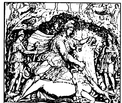
МИТРА УБИВАЮЩИЙ БЫКА

Во-первых, кризис кастовых этнократий, вызванный появлением революционной сущности политического монотеизма, привел к невиданным экологическим катастрофам. Библия — это неэкологическая, противоестественная и противоприродная книга. Единый Бог всемогущ и вершит свой суд над людьми по собственному желанию; те, в свою очередь, отыгрываются на безгласной природе. Древнее языческое богопочитание природы, и именно природы национальной, уходит прочь. Единый Бог не имеет географических и национальных различий, он везде одинаков, как банка «кока-колы». Современные алхимики от морали, обвешанные академическими чинами, не моргнув глазом говорят о Едином веке человечества, единой цели мирового разума, единой морали. Все