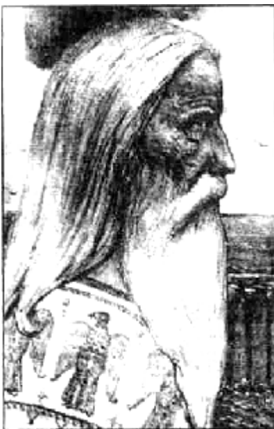
ВОЛХВ С ОСТРОВА РЮГЕН

не сохраняется в Тибете и Индии. В Иране его пришлось отставать Заратуштре, в Скифии оно пало вместе с убийством Анахарсиса — которого греки причисляли к семи мудрецам древности и который не угодил царю Савлию своим почитанием Матери Богов... На Руси исконная власть священнослужителей-волхвов закончилась в эпоху князя Владимира, перенявшего христианскую религию от Византии. Требуется разработки гипотеза о том, что Арсания и после крещения Руси оставалась оплотом укров, или брахманов, — древнейших, араттского происхождения священнослужителей; в то время как русы, пришедшие путем «из Варяг в Греки», представляли славян с издревле возобладавшей в их среде кастой воинов-раджанья.