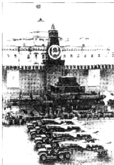
ДЕМОНСТРАЦИЯ ВЕРНОСТИ СОВЕТСКИХ ВОИНОВ ПАРТИЙНОЙ КАСТЕ, ПОДКРЕПЛЕННАЯ РАКЕТАМИ

Петр I, выбивая вторую касту в традиционном русском обществе, не только рубит головы непослушным боярам, он лишает сословие в целом его экономической и юридической независимости. Однако ориентированное на светский образ жизни общество не может управляться жреческой кастой в ее классическом понимании, пусть даже и иноземной по сути. Поэтому впервые создается квазикаста — дво-