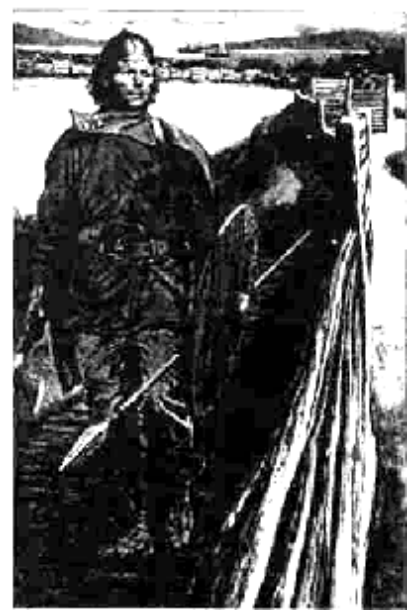
Воин — кшатрий

Представители этой касты составляют в различных, но не вырождающихся обществах от 10 до 20% от общей