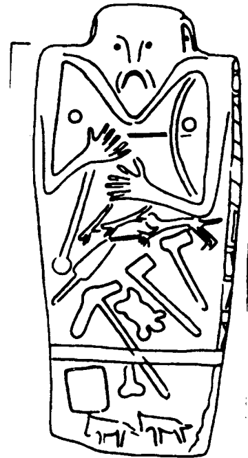
ОТЕЦ СУЩЕСТВ — ПРАДЖАПА-

Главнейшим атрибутом младшего славянского божества, то есть Купалы, был куст или сноп полевых растений; греческого божества — стрелы; индо-арийского — стрела, копье, палица, булава, топор и т.п. Ясно, что первый из вышеназванных атрибутов — древнейший; он восходит к аратто-арийским брасманам — подстилкам из соломы или же связками прутьев и проч., которые сопровождали молитвы и представлялись не столько оружием, сколько магическим орудием воздействия на «Небеса» (что означали имена Дьяуса, Дива и Дим). Ремнищенцы этого орудия обнаруживают стрелы и копьей. Символика булавы и особенно топоров