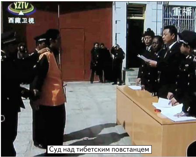
Суд над тибетским повстанцем

и учение Будды, принесены были в Тибет иранскими и индийскими Учителями. Ныне это находит подтверждение в исторических источниках [см. Б.И.Кузнецов «Бон и маздаизм», СПб., 2001]. В VII — IX веках Тибет оспаривал у Китая и Арабского халифата